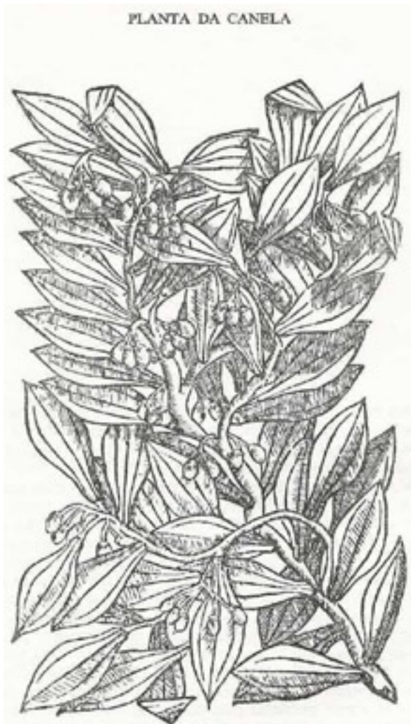
L'arbre à cannelle, gravure issue des Éléments de botanique de Ph. van Tieghem, 1886.

espèces différentes, bien qu'ils appartiennent tous au même genre : Cinnamomum zeylanicum de Ceylan, Cinnamomum iners de Malabar et Cinnamomum burmanii de Java. En ce qui concerne les usages que l'on fait de la cannelle, Orta dit : « C'est un remède doux contre les maux d'estomac et pour calmer les douleurs de la colique [...] ; elle supprime la mauvaise haleine et, en plus d'avoir des propriétés médicinales, elle est savoureuse et bonne pour assaisonner les plats, comme cela se fait en Inde. »