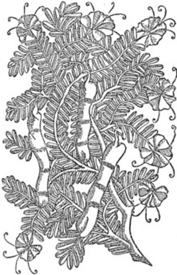
Este fruto parece-se com as alfarrobas.

Tamarindo. Gravure du livre de Cristóvão da Costa, Tratado de las drogas y medicinas de las Indias Orientales , 1578.