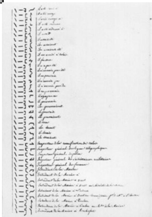
Mots et expressions complémentaires du vocabulaire de 1807 (1822).