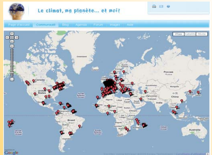
Répartition géographique des 8000 classes inscrites au projet Le climat, ma planète... et moi ! , un an après le lancement du projet.

L'étude des calendriers actuels (grégorien, musulman,